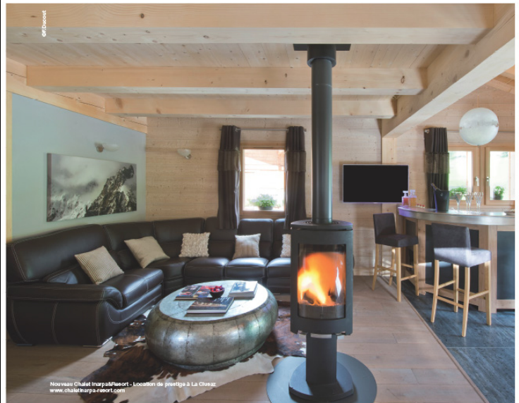
Nouveau Chalet Inrapaléart - Location de prestige à La Clusaz www.chaletinrapaleart.com

MARIE CLAIRE MAISON RHÔNE-ALPES - N° 475 FEVRIER - MARS 2015 RÉDACTION ET PUBLICITÉ : TRIGONE MAGAZINES : SOPHIE AJELLO - RÉDACTION CATHERINE CLAUDE 56, PLACE DE LA RÉPUBLIQUE - 69002 LYON - 04 72 41 71 72 - PUBLICITÉ : PATRICIA VAL 06 23 15 45 63